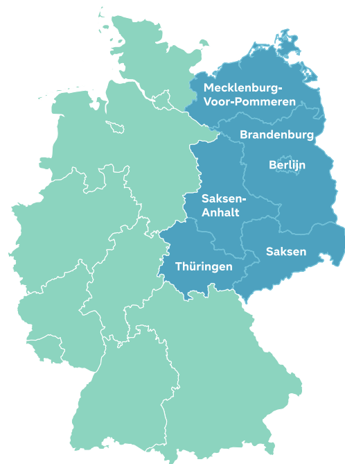
Fig. 2 - Grens West en Oost-Duitsland in beeld

Na WOII bestond Bondsrepubliek Duitsland uit West-Duitsland ( BRD ) en Oost-Duitsland ( DDR ). Vanaf 1961 werd het land gescheiden door de Berlijnse muur. Waar in de BRD democratie heerste, was de DDR communistisch vanwege de bevrijding van Oost-Duitsland door de Sovjet Unie.