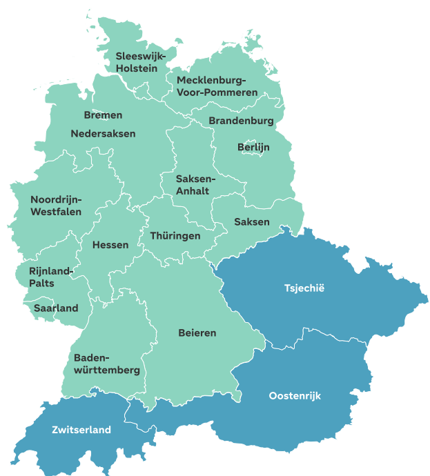
Fig. 1 - Grens Noord- en Zuid-Duitsland in beeld

In de periode daarna zien we de oorsprong van de verschillen tussen Noord- en Zuid-Duitsland. In het noorden werd Pruisen als belangrijkste staat gezien, in het zuiden Oostenrijk, Beieren, Baden en Württemberg. Toen in 1866 de Duitse Oorlog